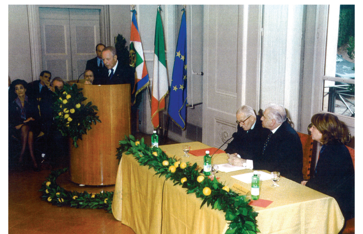
11. Il Presidente della Repubblica Italiana, Carlo Azeglio Ciampi, Accademico della Crusca honoris causa , tiene il suo discorso sulla lingua italiana nell'Accademia (9 aprile 2002).

12-14. Pubblicazioni dell'Accademia della Crusca nelle varie collane.