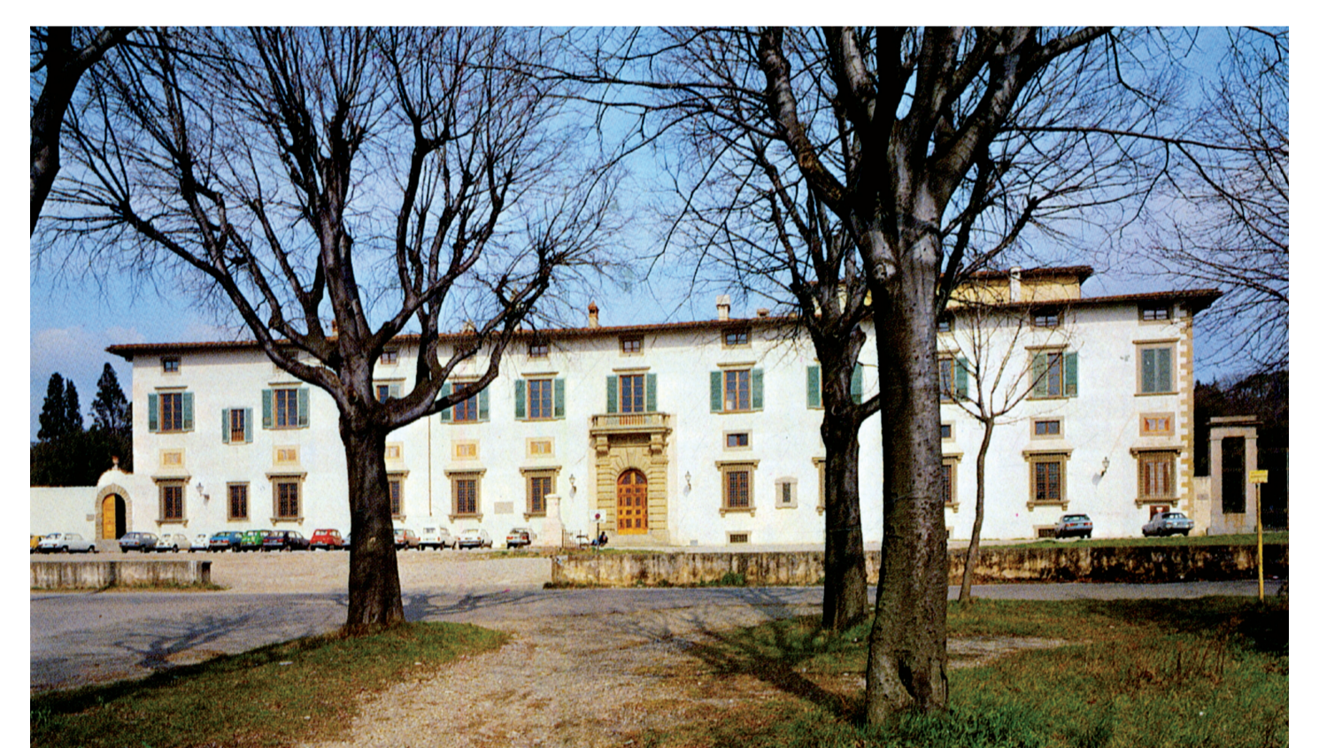
8. La Villa Medicea di Castello a Firenze, sede dell'Accademia della Crusca.