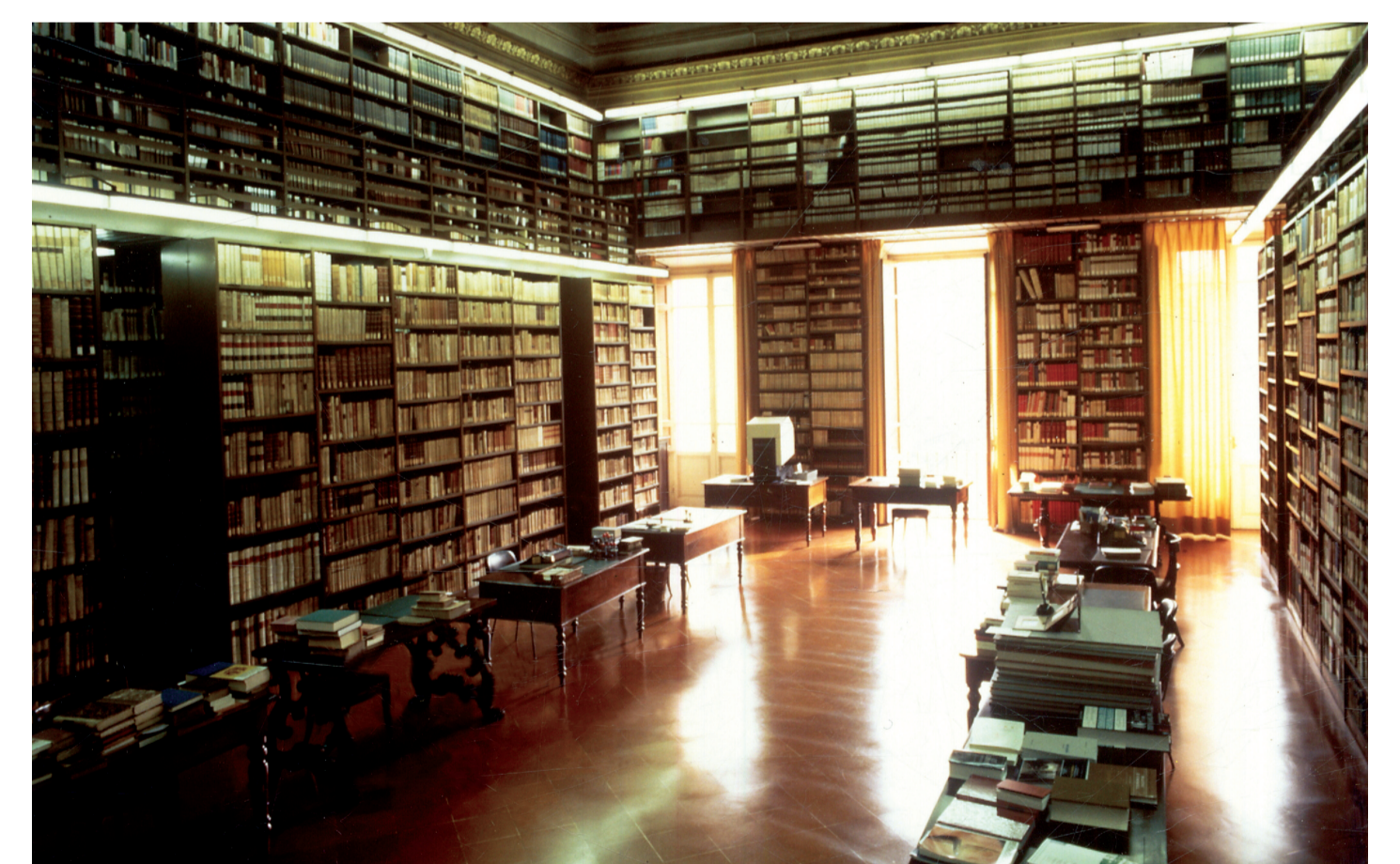
10. Firenze, Accademia della Crusca, Biblioteca.

Di anno in anno L'Accademia della Crusca attua iniziative, sotto il patrocinio del Capo dello Stato, per diffondere la coscienza dei valori civili della lingua nella nostra comunità nazionale e della sua funzione di tramite di cultura da e verso tutti i popoli del mondo . Negli anni 2001-2003 è stata tra i promotori della "Federazione Europea delle Istituzioni Linguistiche Nazionali" (costituita a Stoccolma il 14 novembre 2003) che abbraccia tutti i Paesi membri dell'Unione ed è sostenitrice di una politica di salvaguardia delle lingue nazionali come " patrimonio comune di ogni abitante dell'Europa ".