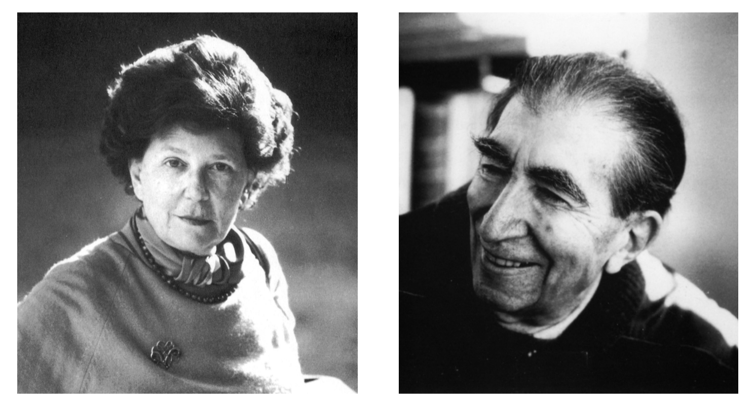
6. Maria Corti (1915-2002). 7. Gianfranco Contini (1912-1990).