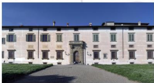
Sala Conferenze dell'Accademia della Crusca

Piano terra, superato l'ingresso, a destra