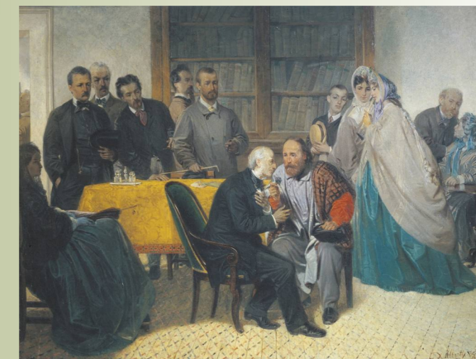
Sebastiano De Albertis, La visita di Garibaldi a Manzoni (Museo del Risorgimento di Milano)