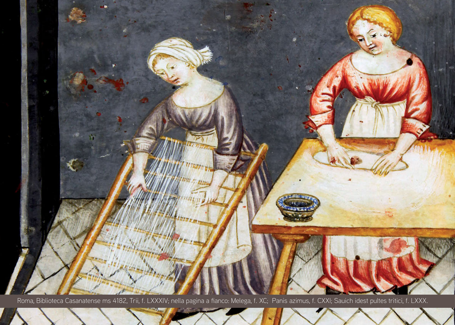
Roma, Biblioteca Casanatense ms 4182, Trii, f. LXXXIV; nella pagina a fianco: Melega, f. XC; Paris azimus, f. CXXI; Sauich idest pultes tritici, f. LXXX.