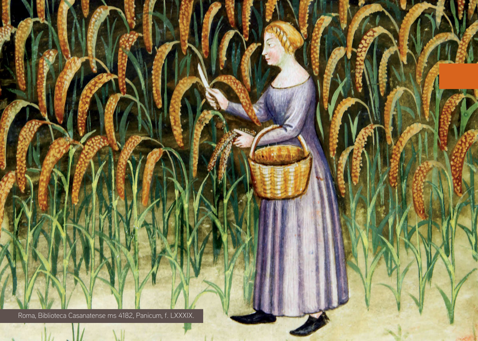
Roma, Biblioteca Casanatense ms 4182, Panicum, f. LXXXIX.