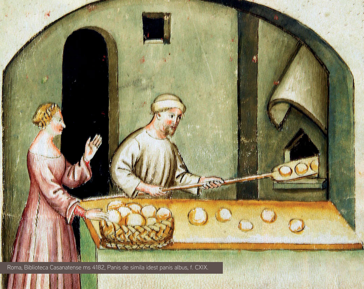
Roma, Biblioteca Casanatense ms 4182, Panis de simila idest panis albus, f. CXIX.