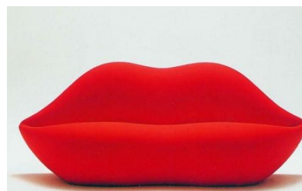
Divano Bocca - 1970 Studio65