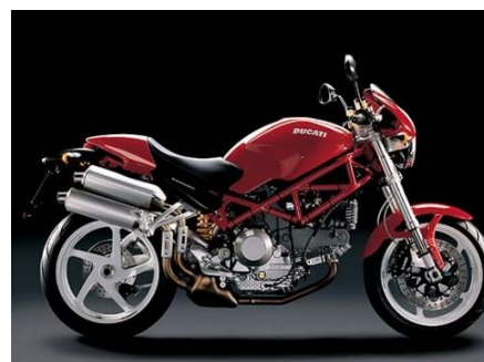
Ducati Monster -1992 Miguel Galluzzi per Ducati