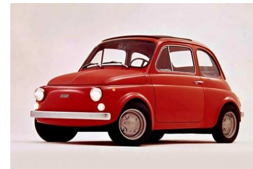
Fiat 500 - 1957 Dante Giacosa per Fiat