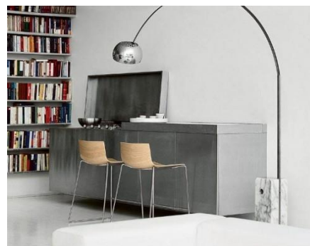
Lampada Arco - 1962 Achille e Giacomo Castiglioni per Flos