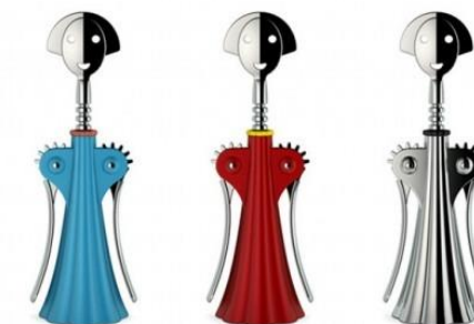
Anna G. Cavatappi - 1994 Alessandro Mendini per Officina Alessi