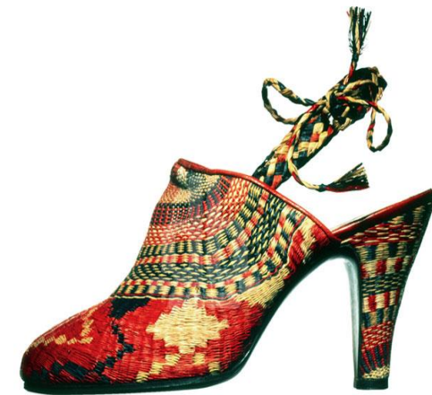
Salvatore Ferragamo, sandalo femminile, 1936-38 Museo Salvatore Ferragamo - Firenze